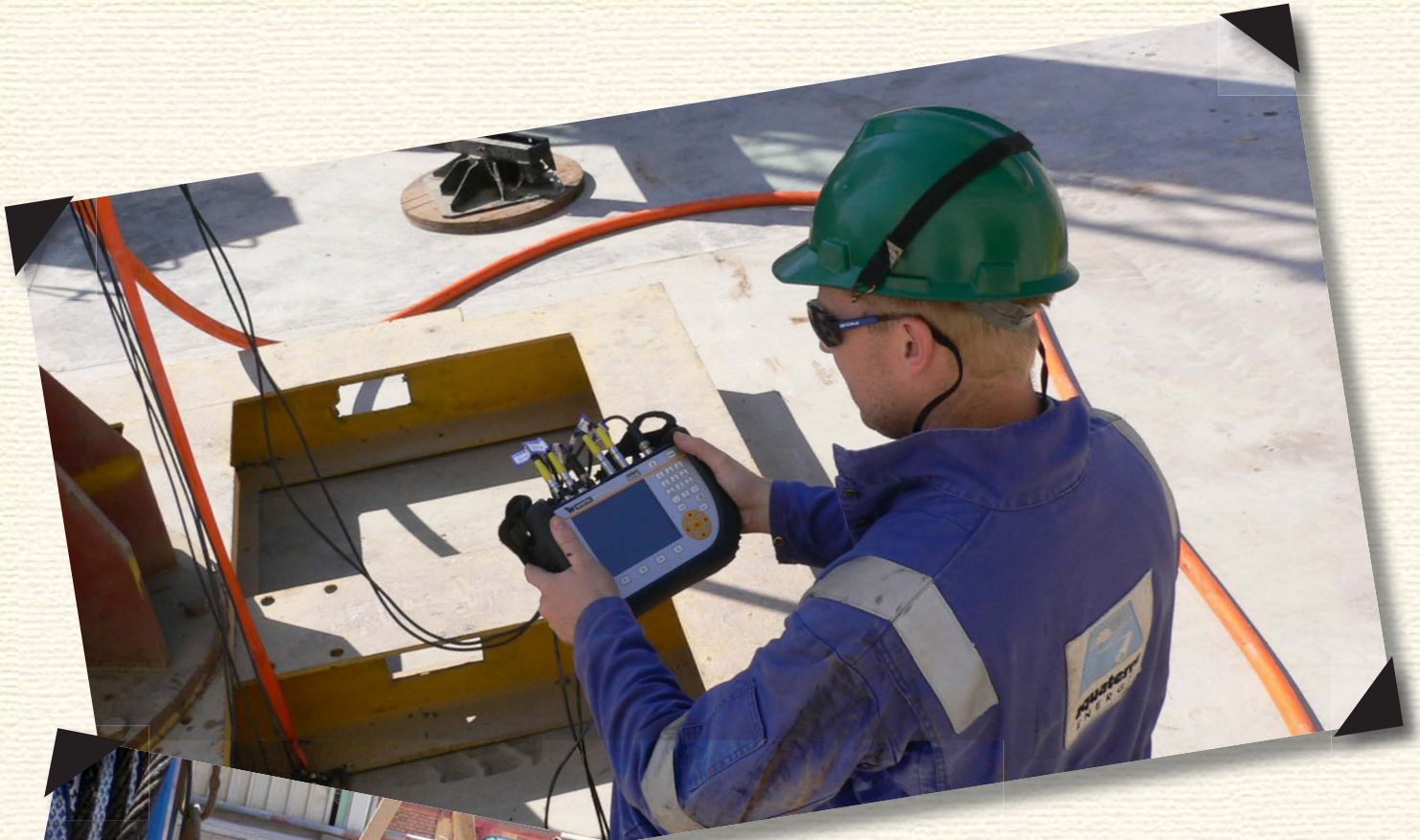
Der HPM6000 im Einsatz