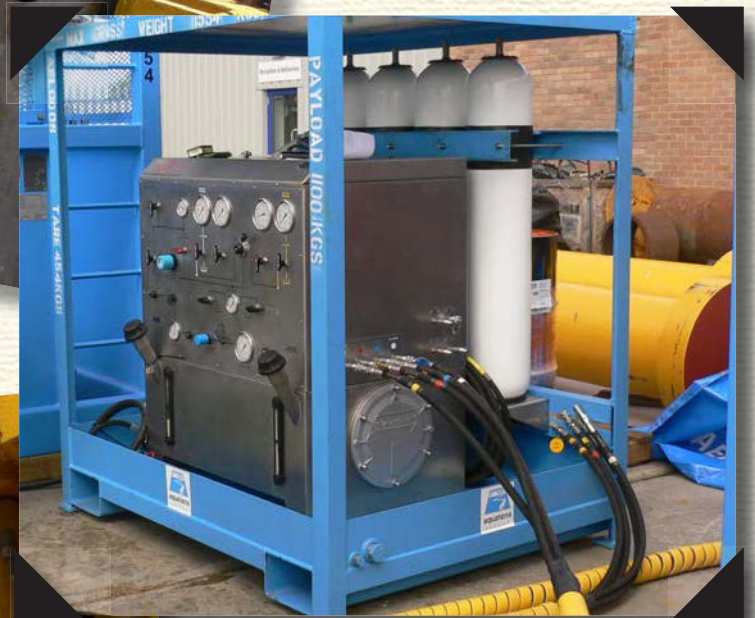
Das Hydraulikaggregat (HPU) von Hyco