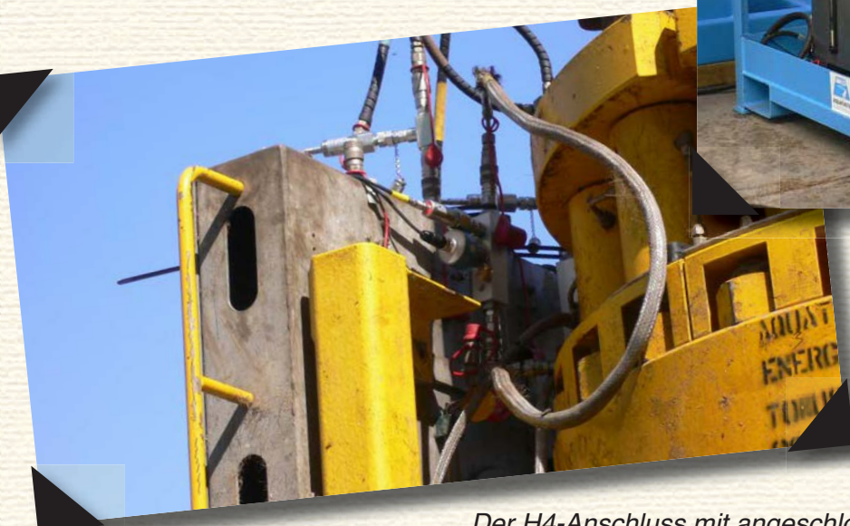
Der H4-Anschluss mit angeschlossenem Prüfgerät